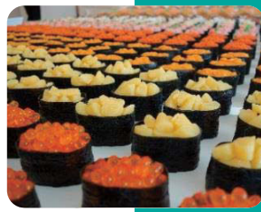
看到我最爱的寿司，口水都快掉下来了！