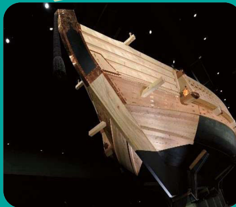
最新的技术让我们仿佛坐在真的船上~