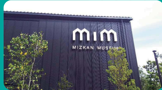
详细的介绍了江户时代的制醋工艺！

MIZKAN是创业于1804年的日本传统制醋企业。该博物馆利用最先进的成像技术以及提供亲身体验的方式，将真实的日本制醋工艺的历史呈现给参观者。