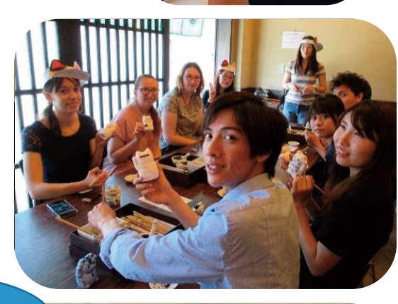
그림 넣기 완성