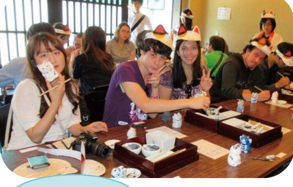
그림 넣기 종료