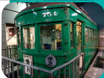
Esta linha era utilizada para transportar as cerâmicas de Seto, ajudando assim a que estas se tornassem famosas. Tanto a estação como o comboio daquela época estão em exibição.

Estou tão feliz por ter recebido uma malga!